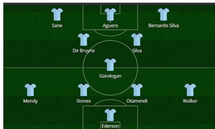
ALINEACIÓN PROBABLE: best11.eurosport.com

Aunque ya sabemos que adentrarse en la mente de Guardiola es lanzarse a un imposible, el once prototipo sería el siguiente.