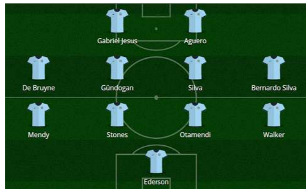
VARIANTE 4-4-2

Otras dudas son Stones, que la temporada pasada estuvo muy lejos de ese jugador que maravilló en el Everton, y Leroy Sané, que podría salir del once en detrimento de Gabriel Jesús, con lo que el sistema de juego cambiaría a una especie de 4-4-2 en el que De Bruyne sería desplazado a la izquierda y Silva ocuparía un puesto en la medular con Gündogan, formando una dupla de mucha calidad pero de poco físico, lo cual es una apuesta de riesgo en un campeonato como la Premier, tan duro y en el que la mayoría de los partidos se vuelven un correcominos.