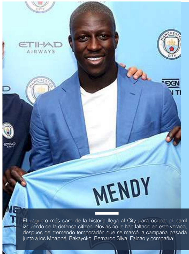
El zaguero más caro de la historia llega al City para ocupar el carril izquierdo de la defensa citizen. Novias no le han faltado en este verano, después del tremendo temporada que se marcó la campaña pasada junto a los Mbappé, Bakayoko, Bernardo Silva, Falcao y compañía.

Aunque ya sabemos que adentrarse en la mente de Guardiola es lanzarse a un imposible, el once prototipo sería el siguiente.