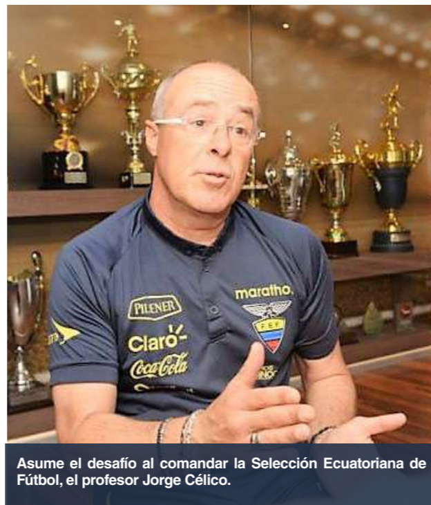
Asume el desafío al comandar la Selección Ecuatoriana de Fútbol, el profesor Jorge Célico.

Pese a que Ecuador no logró la clasificación al Mundial de Rusia 2018, se espera un cambio íntegro en lo que concierne a la Federación Ecuatoriana, y así se vea reflejada en la Selección, en el desempeño, en la nueva generación que defenderá los colores: amarillo, azul y rojo.