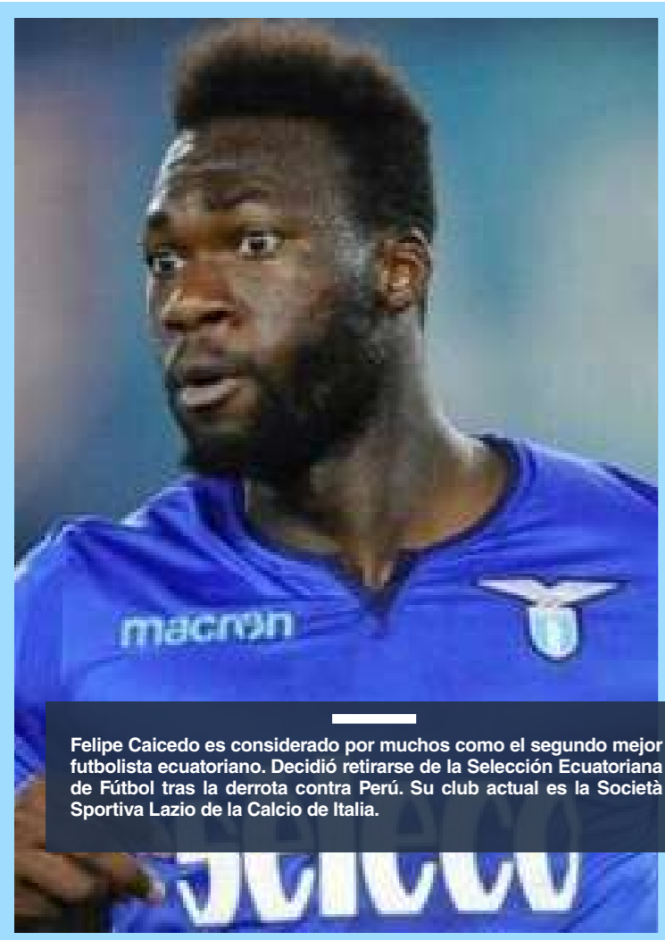
Felipe Caicedo es considerado por muchos como el segundo mejor futbolista ecuatoriano. Decidió retirarse de la Selección Ecuatoriana de Fútbol tras la derrota contra Perú. Su club actual es la Società Sportiva Lazio de la Calcio de Italia.