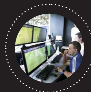
LaLiga será la última de las grandes ligas europeas en incluir este sistema.

EL VAR POSIBILITA AYUDA TANTO A ÁRBITROS COMO A EQUIPOS