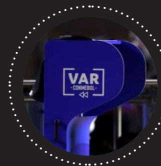
Sistema de Asistencia Arbitral por Video (VAR)